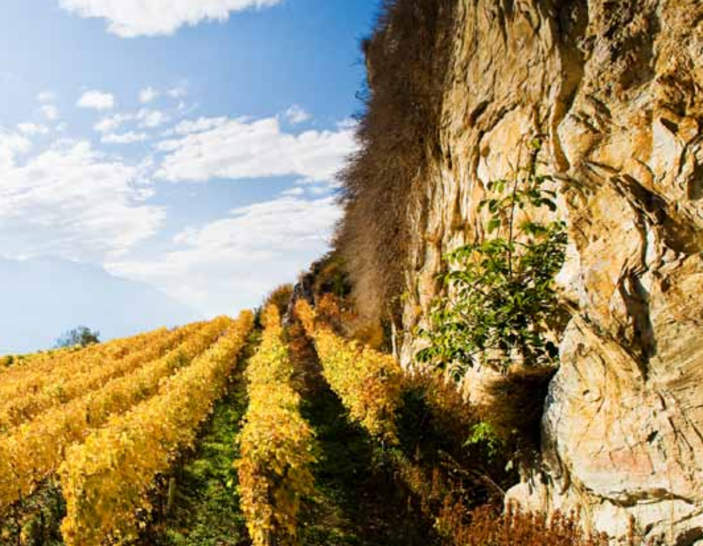
Domaine de l'Ormy : Chasselas (Fendant)