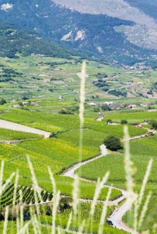
Vignoble de Miège : Pinot et spécialités